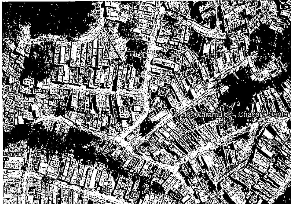
Rua dos Caramujos (antiga Rua 5), Chácara Santa Cecilia

Projeto de Lei Nº 72/2026 - Processo 103/2026 Documento assinado digitalmente em 12/03/2026 PROTOCOLO 8049/2026 - 12/03/2026 16:06 - PROCESSO 103/2026. Para ver o arquivo original acesse http://siave.camaratapevi.sp.gov.br/Siv/Siv.do?documentos/autenticar e informe a chave: 7BFM-P876-17A3-SXHY