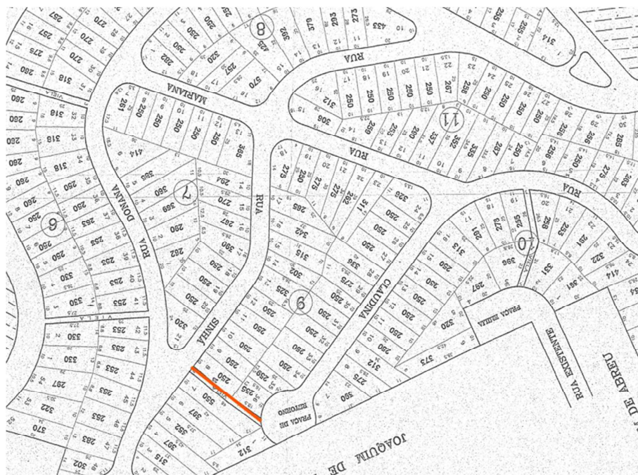
Vila sem denominação Vila Dr. Cardoso, Itapevi