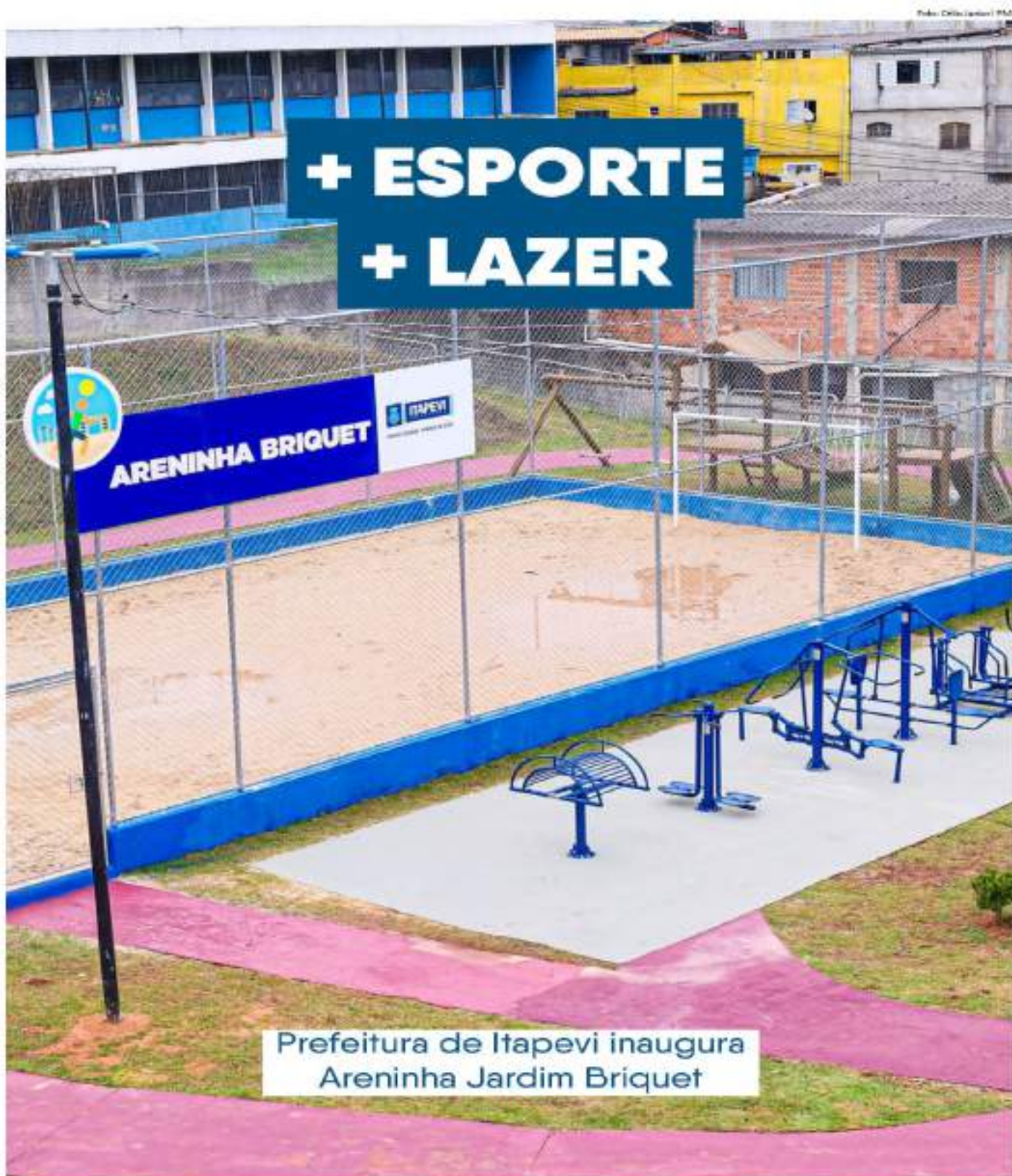
Prefeitura de Itapevi inaugura Areninha Jardim Briquet