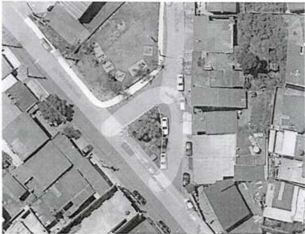
Praça sem denominação, Rua Paulo Cesar Duarte, Jardim Itacolomi, Itapevi-SP

PREFEITURA MUNICIPAL DE ITAPEVI SECRETARIA DE DESENVOLVIMENTO URBANO E ORDENAÇÃO DO SOLO Rua Agostinho Ferreira Campos, 675 – Cidade Saúde | Itapevi | São Paulo | CEP: 06693-120