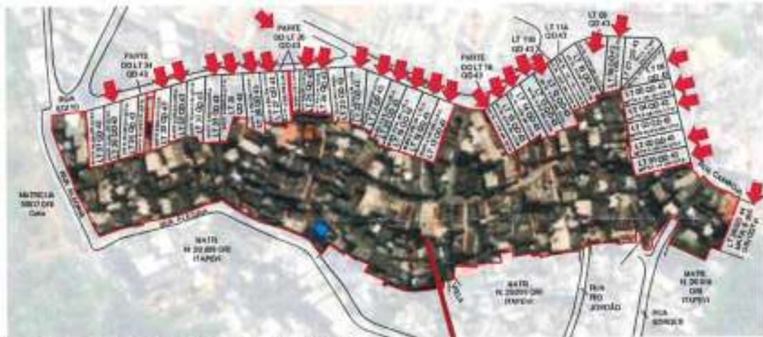
Localização da área a regularizar- NÚCLEO EGITO

Rua Agostinho Ferreira Campos, 675 – Cidade Saúde - CEP 06693-120 Telef.: 4143-7600 – sehab@itapevi.sp.gov.br