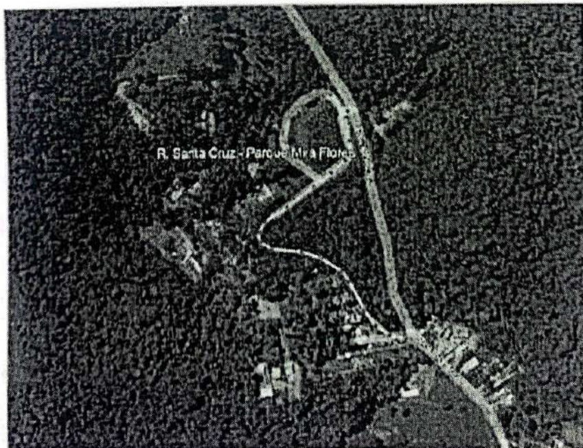
Rua Valencia, Chácara Lagoinha