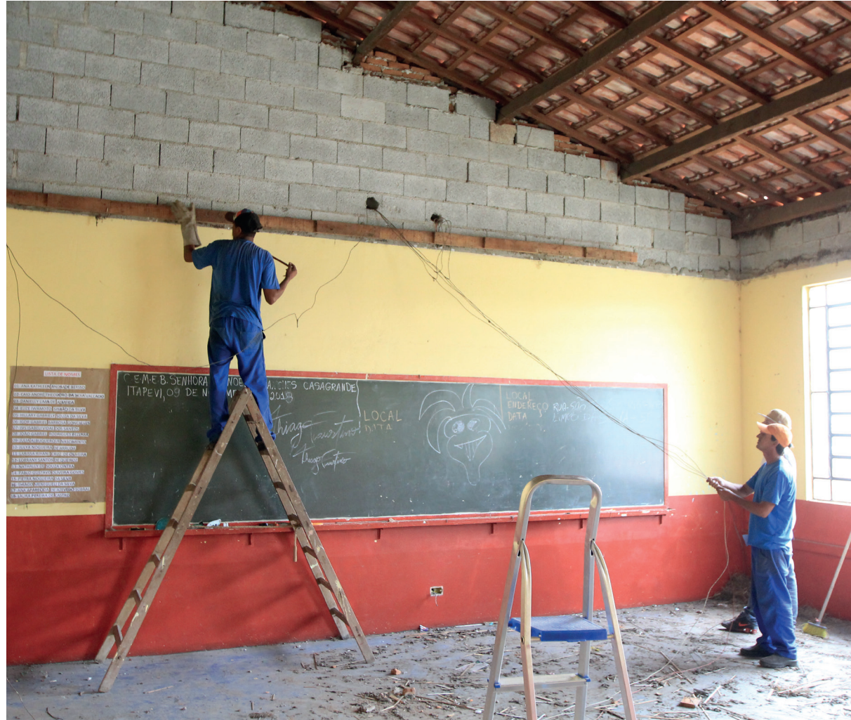
Reforma no CEMEB Sra. Manoela Sanches Casagrande

Além da reforma das escolas, faz parte do planejamento de ações da Prefeitura a construção, em 2018, das duas primeiras escolas de tempo integral de Itapevi. A entrega de materiais e uniformes escolares no início do ano e a retomada do desfile cívico de 7 de setembro, como celebração permanente no calendário de eventos da cidade.